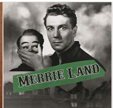
The Good, The Bad and The Queen - M...