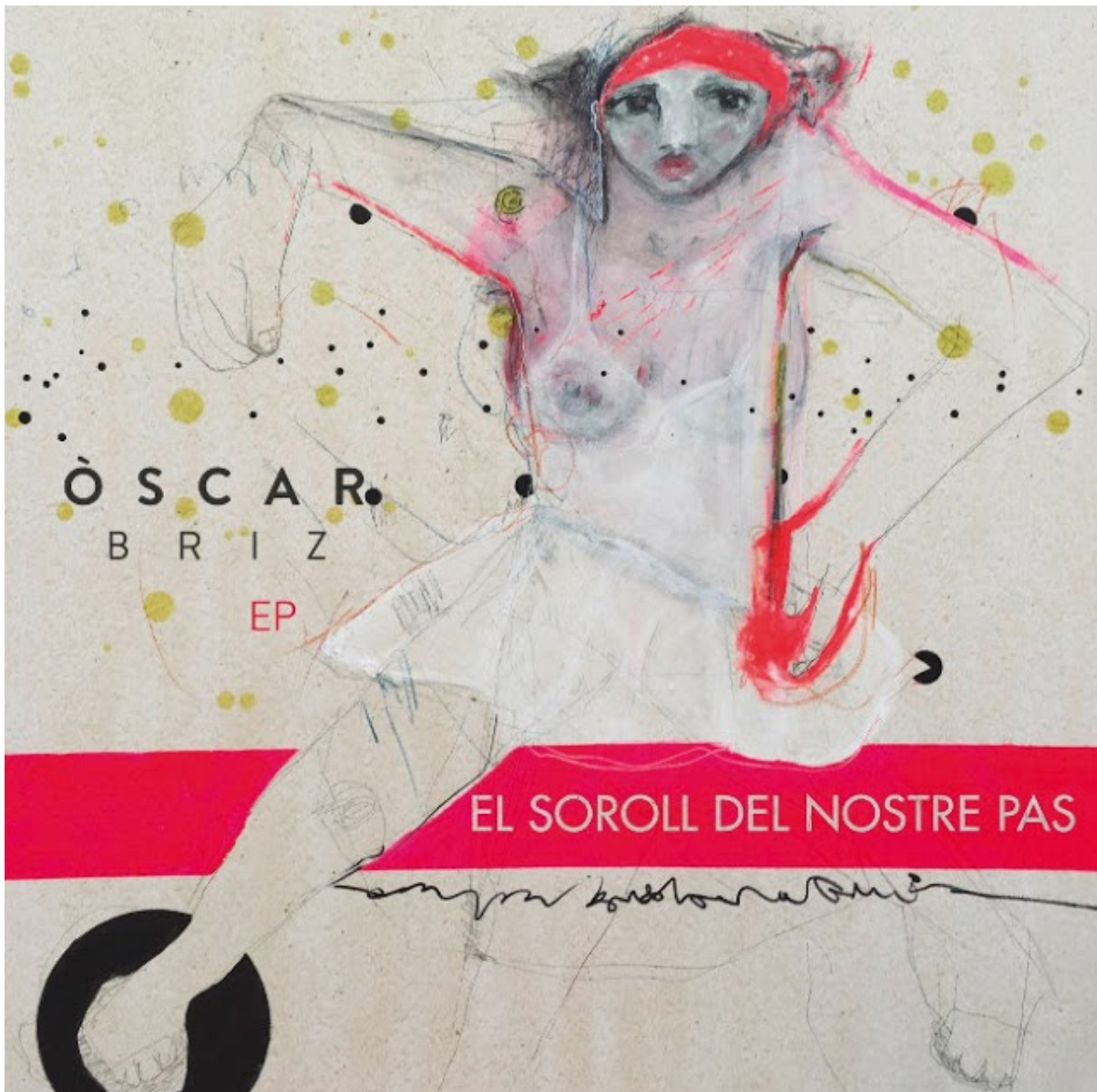
Título: El Soroll del nostre pas - Intérprete: Óscar Briz