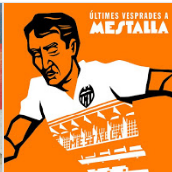
Cisco Fran & La Gran Esperanza Blan...