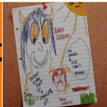
Baby Scream - Things u can say to a...