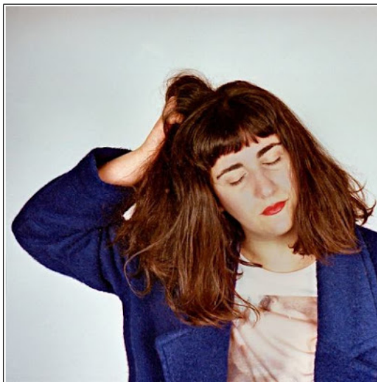
Lanuca - Himalaya

De su contenido más detallado podríamos decir que en " Durazno " hay aires orientales, místicos y de gravitación, como si la vida pendiera de un fino hilo y tratase de crear perdurabilidad de hechos cotidianos en la memoria. Con " Himalaya " incide todavía más en esa sensación espacial donde lo sentimental y emotivo retozan plácidamente en un ritual de la madre naturaleza.