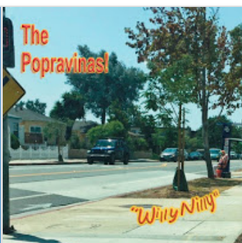
The Popravinas - Willy Nilly (2019)