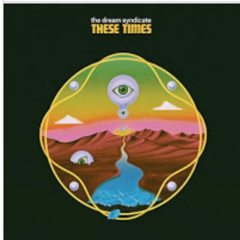
The Dream Syndicate - These times (...)