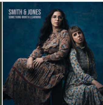
Smith & Jones - Something Worth Lea...