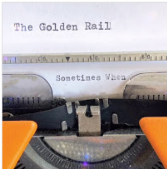
The Golden Rail - Sometimes when (2...