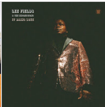
Lee Fields - It Rains Love (2019)