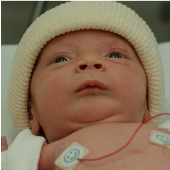
Imagen del bebe protagonista de «En buenas manos»