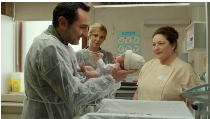
Momento del encuentro del bebé con el padre de acogida

«En buenas manos» es un peliculón que debería ver todo el mundo. Se trata de uno de esos films que exudan humanidad por los cuatro costados, cosa que de vez en cuando viene muy bien en estos tiempos. Además aporta mucho a la hora de conocer y comprender los intringulis que plantea una adopción entre los futuribles padres, así como los variopintos motivos que pueden llevar a la renuncia del bebé por la madre biológica o la admirable labor de complejos trámites que realizan los funcionarios en las respectivas etapas del mencionado proceso adoptivo.