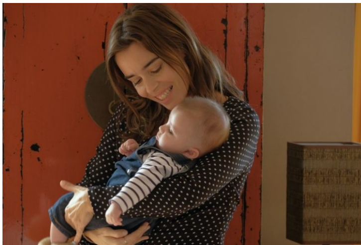
Momento del encuentro del bebé con la madre adoptante

También me gustaría recalcar la manera en que pone de relieve la apertura a nuevos modelos de familia, en este caso monoparental y, sobre todo, la labor del padre de acogida que sorprende al utilizar la figura de un hombre con imagen ruda pero que desprende mucha entrega, ternura y comprensión.