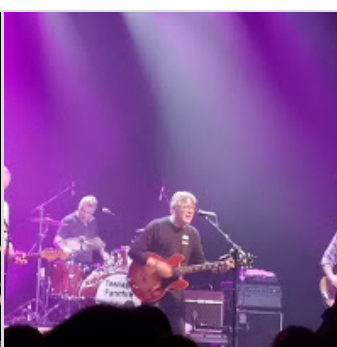
Crónica del concierto de Teenage Fa...