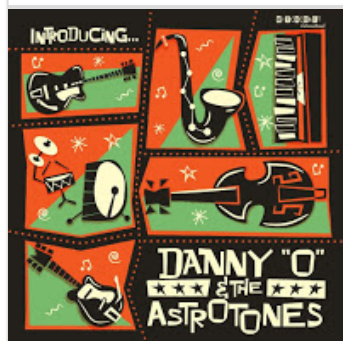
Danny 'O' & The Astrotones - Introd...