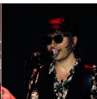
Con Guttercats (crónica conciertos ...