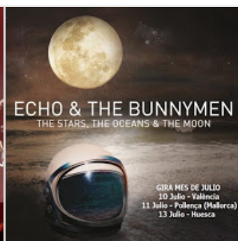
Nueva gira en Julio de Echo & The B...